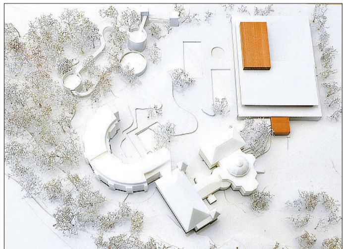
BAINS D'YVERDON. Credit Suisse Funds participent à hauteur de 23 millions au projet de rénovation du groupe Boas.